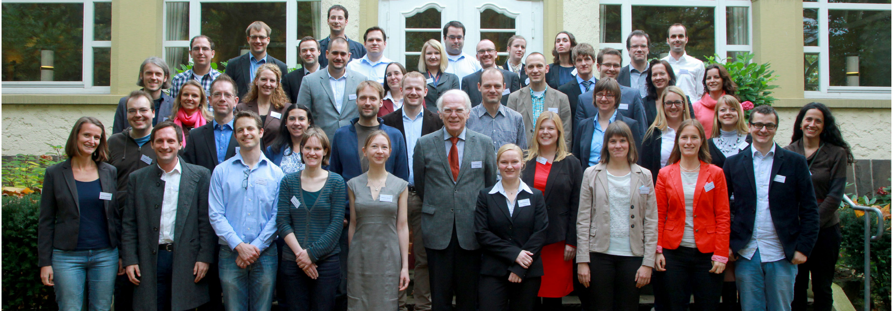
Auftakt GYF III