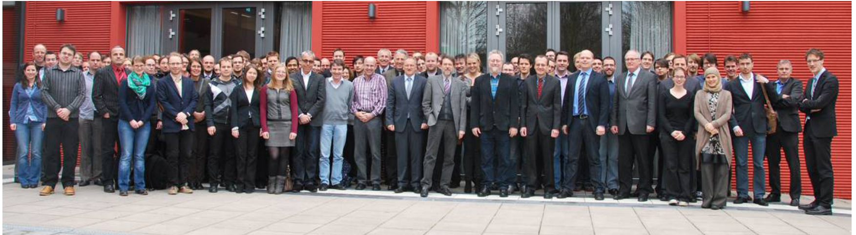
Mitglieder des SFB 823 der TU Dortmund